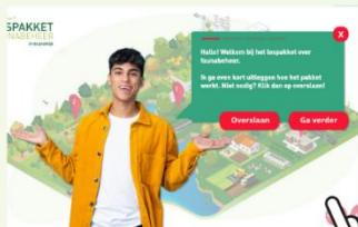
Faunabeheer in de praktijk mbo niveau 2

Dit lespakket is te vinden op www.blauwgroenlespakket.nl . Hier is nog veel meer gratis online (les)materiaal te vinden, bijvoorbeeld: