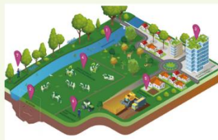
Biodiversiteit en kringlooplandbouw vmbo klas 3-4