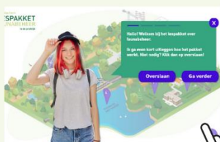
Faunabeheer in de praktijk vmbo klas 3-4

Dit lespakket is te vinden op www.blauwgroenlespakket.nl . Hier is nog veel meer gratis online (les)materiaal te vinden, bijvoorbeeld: