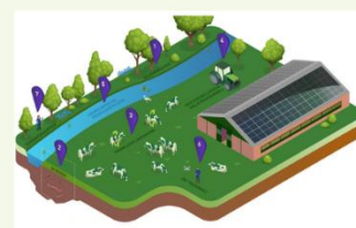
Biodiversiteit en kringlooplandbouw op melkveebedrijven voor mbo 2