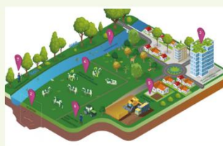
Biodiversiteit en kringlooplandbouw vmbo klas 3-4